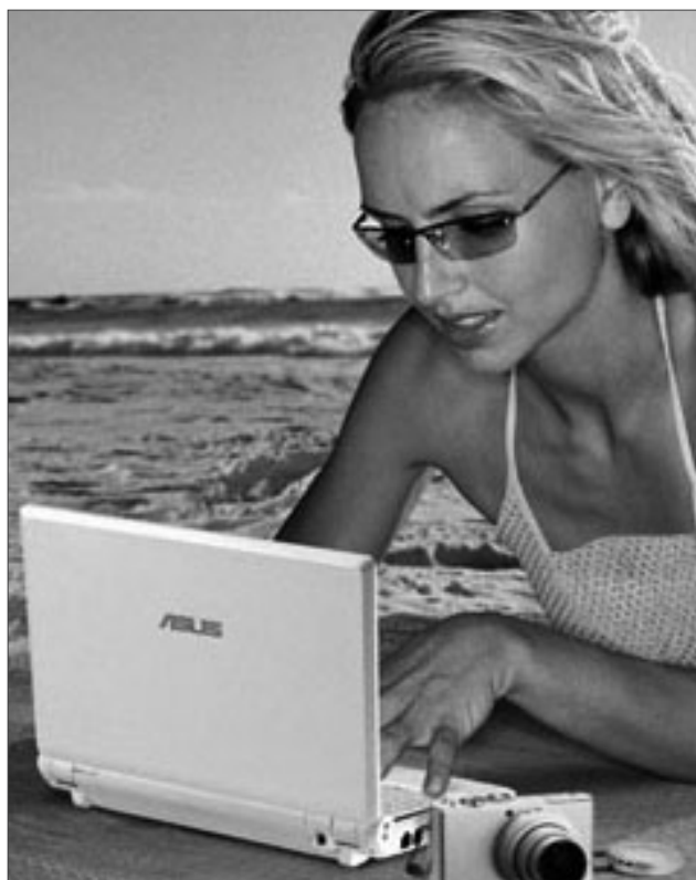
Imagen utilizado con permiso.